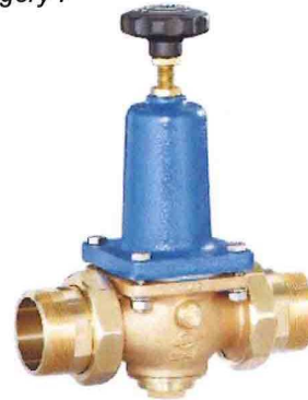
DN 40 - DN 65